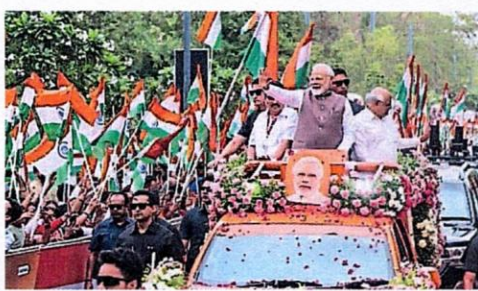
प्रधानमंत्री नरेंद्र मोदी ने मंगलवार को गांधीनगर में रौड शो किया, मुख्यमंत्री भूपेंद्र भाई पटेल भी शामिल हुए

मोदी ने कहा कि बड़ोदरा, दाहो, भुज, अहमदाबाद और गांधीनगर की यात्रा के दौरान उन्हें 'अपरेशन सिंदूर' को सफलता की गर्जना के साथ देशभक्ति का जोश महसूस हुआ, तथा वह पाकाना पूरे देश में देखी जा सकती है। प्रधानमंत्री ने कहा कि एक कठोर लगातार दर्द दे सकता है, मले ही शरीर क्लिप्तता भी मजबूत क्यों न हो। उन्होंने कहा कि भारत ने 'आतंकवाद के कटोरे को फिलाने' का मन बना लिया और इसे पूरी दुनिया के साथ किया।